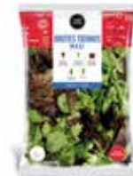
Brotos Tiernos Maxi