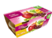
Tarrito de fruta variada